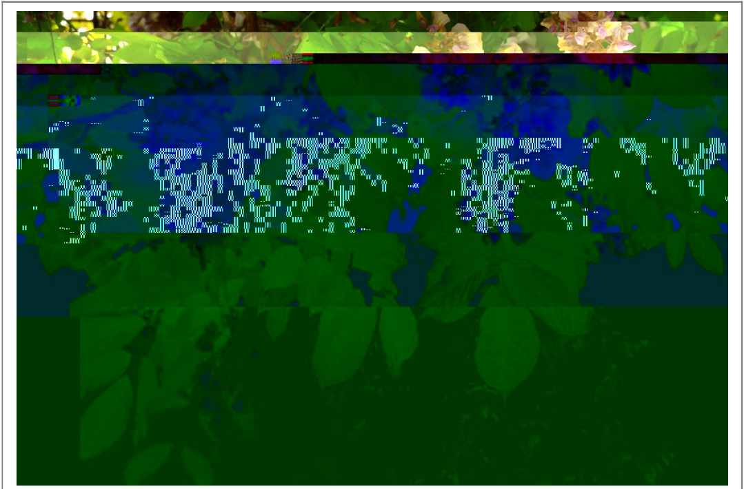
紫藤花开 露 \ 摄

Z 6/ 6<vf| [ 阅N[ 体4=&x1kt 6一些5薄 见# <&4t 27去6>C- E •些>C化{ kl 6-CP=而 那些>C塑 R&46\生轨 X=也寄托R&46情<归 | &%DT xwC斯-e 审 视kt 67去=2那些 清Z 6 / 6瞬间f| } ~跑{ <受G kt 6c脏猛烈撞击 膛=$} T-Z 6 v 吵{ K夜躺+ 床5辗H[ 侧=抑 } K Aq N{ 巨36c@#n •些> I HR足P让&<受G] 清Z f= k •种<vR##} 情<6 波1 =$有M魂6B撼=>KD铭 c6| &i / $+t 2• e6G D=也+努U体4生/ K6h个 GD| 有G\生$需8• 么一个契 机= 1也Z =Z 也罢=踏5一 趟c M6x 车=P一种5F 6视 角看待kt T(I 6一切|