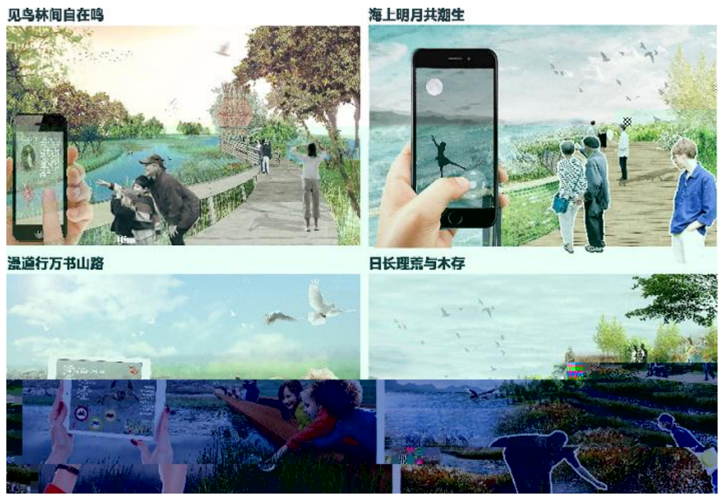
日前,由中国风景园林学会主办的中国风景园林学会2021大学生设计竞赛落下帷幕。我校生态学院学生团队的参赛项目“‘潮’起鸟鸣,月海呼‘汐’——基于互生互生智慧科普的西沙湿地公园局部改造设计”荣获二等奖,实现了我校在此项赛事中的 !。(生态学院供稿)

118 s 2021 M i # So q k g O ( 5 q v N ` 7x q ( ) ^ ^ d • l gN 7 P l ) ^ a 7 q r F % l d ! ^ q / , l q APP q ^ ! # " sSa ^ ! q ^ , 1 ! , t? ) ` q ^ q /" + ! q S 1 !! A5 , gh gNI + H t c ^ gh% , * % ^ G *M E , L F s m o 用实践行动筑牢思想之基 2021 7y 100 ( q O l 2 P 7 s s OK O 100