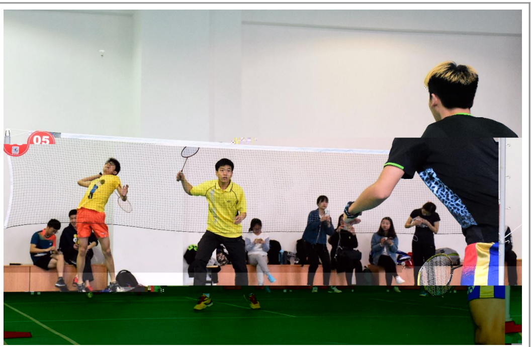
4- 8. /2017Q 232456 789: ; ; <=>?@ABCD= EFGHI /J KD= LM$ NOPQR9: STPQU 122VSWXYZ[ \V] ^_` aBbcdef ghij kl m>nopL qr EFst luvEFst wxryEUz { R| } ~• a