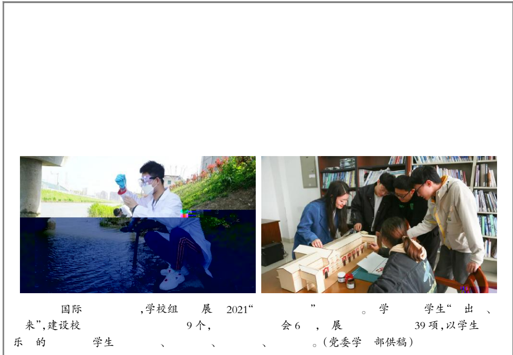
国际...学校组展2021“...”。学...学生“出、...”。(党委学...部供稿)