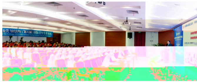
图为大会现场

已 解 真诚欢 待 英 梦 迎 英 谱 华章 启 章 正 快 转 篇章 ( 4 )