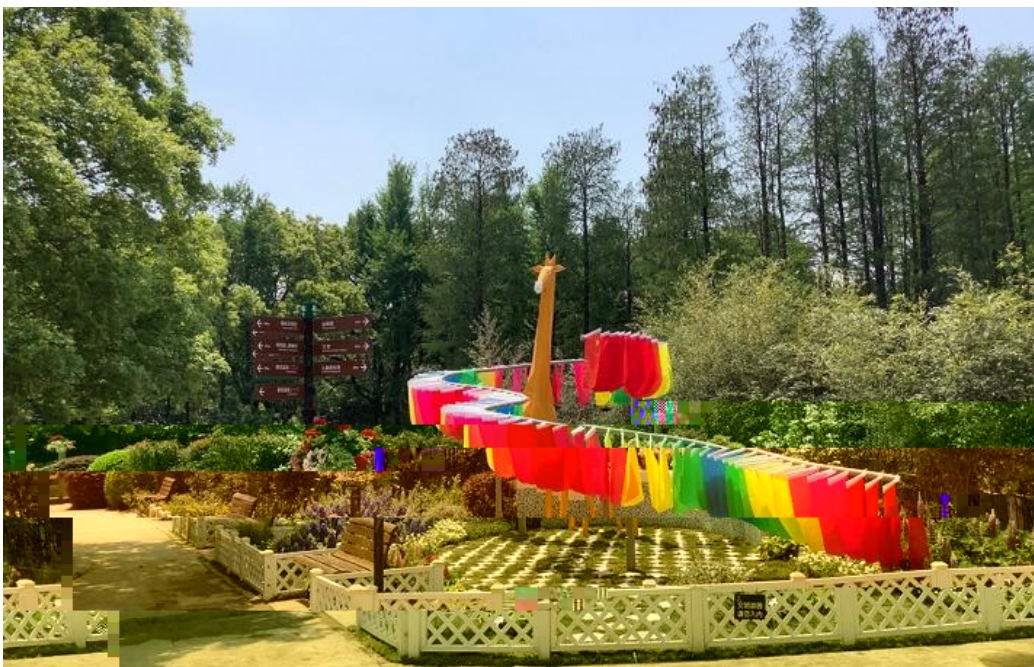
2020 般 凌 跃 而 绕 而 多 共 存 是 陆 丝 绸 之 望 缩 影 寓 意 是 连 世 界 筑 繁 同 时 为 了 响 应 抗 击 疫 情 号 召 高 高 颈 还 戴 了 手 缝 制 口 罩

时代新 青年担 U 控 W 击 & 青春力量 各 党政 s 人 各 职 c 处 s 人 也 k k 网络 * 线 团 员 青 年 五 i t u 与 青 年 成 员 青 年 五 i t u 与 青 年 成 长 控 与 青 年 担 等 团 员 青 年 讲 主 题 I 团 7 发 团 员 青 年 D 国 主 怀 增 强 新 时 代 青 年 团 员 历 S 使 命 和 任 感 导 师 + 党 员 + 生 也 参 与 本 主 题 团 日 充 分 发 m ` 模 范 引 领 作 与 团 员 青 年 线 i D 新 n opq 新 行 m 助 力 R 7 r 7 心 和 7 [ s t 人 生 发 Pu