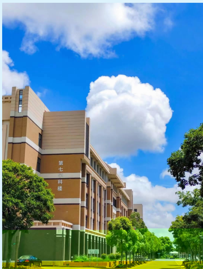
校园一隅

九重天下，身挺如松。 热浪与汗珠中，我们坚定踏步！ 一步是团结，一步是自强！ 上苍用至